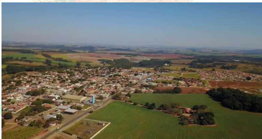
Figura 1 - Vista aérea do município de Guapirama.

Guapirama-PR foi elevado à categoria de município em 1964, através da Lei Estadual nº 4.842, de 02 de março de 1964, na gestão do então Governador Nei Amintas de Barros Braga, deixando a categoria de Distrito Judiciário e desmembrando-se, assim, do Município de Joaquim Távora, conservando a mesmas divisas do Distrito. Sua instalação data de 19 de dezembro de 1964,