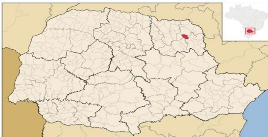
Figura 2 – Localização do município de Guapirama no mapa do Paraná.